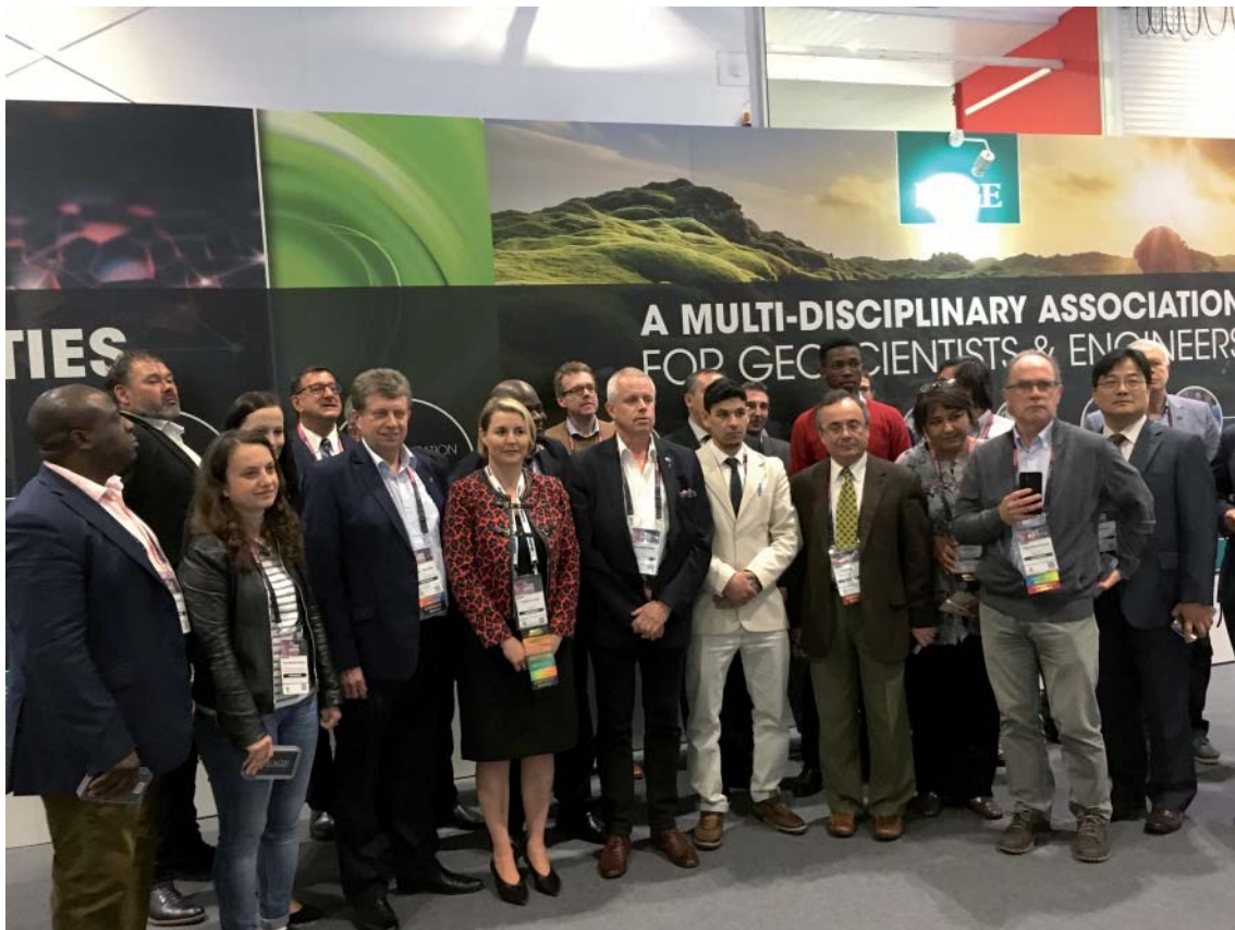
Керівники національних асоціацій на зустрічі з президентом EAGE (2017–2019) Жан-Жаком Біту (в центрі)