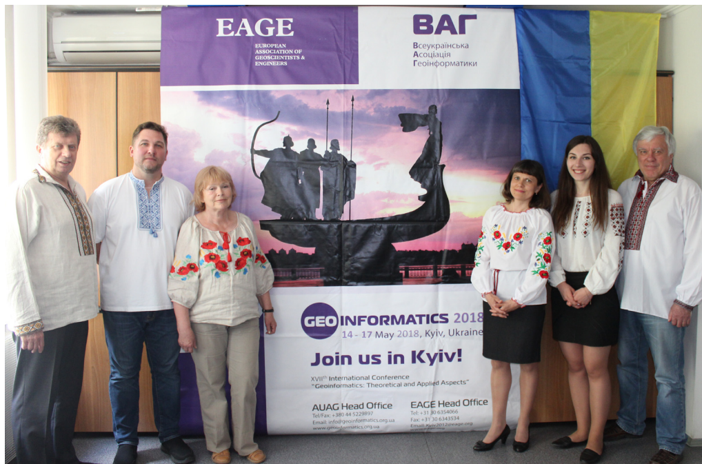
Оргкомітет конференції “Геоінформатика: теоретичні та прикладні аспекти”

EAGE – професійна асоціація геологів, геофізиків, інженерів і фахівців наук про Землю, заснована в 1951 р., її штаб-квартира знаходиться в Нідерландах (м. Хоутен). Асоціація об’єднує в своїх рядах понад 19 000 членів з більш як 100 країн світу. З кожним роком щорічна конференція EAGE зби-