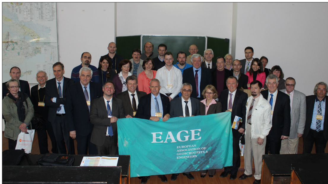
Учасники XVI Міжнародної конференції “Геоінформатика: теоретичні та прикладні аспекти”

18 травня 2017 р. завершила свою роботу XVI Міжнародна конференція “Геоінформатика: теоретичні та прикладні аспекти”. Організаторами заходу вже традиційно були Європейська асоціація геовчених та інженерів (EAGE) і Всеукраїнська асоціація геоінформатики (ВАГ). Слід зазначити, що підвалини цього щорічного заходу започатковано з ініціативи Центру менеджменту та маркетингу в галузі наук про Землю Інституту геологічних наук (ІГН) НАН України.