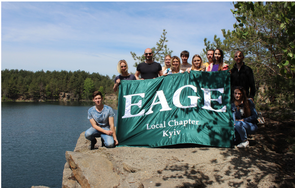
Учасники геологічної екскурсії на гранітному кар’єрі, м. Коростишів

Підкреслимо, що конференцію проведено за партнерства з EAGE. Нагадаємо, що цьому передувала знакова для геологічної спільноти України